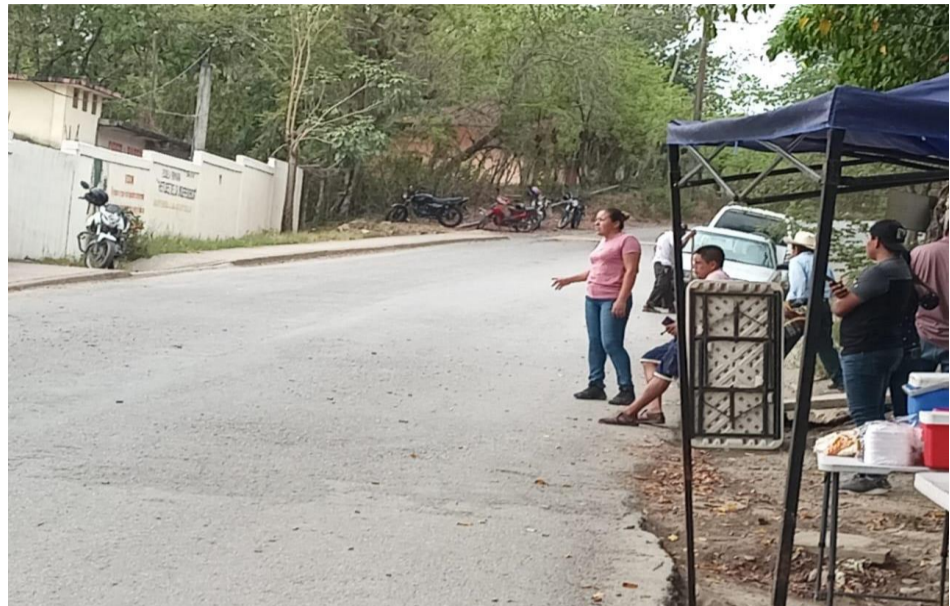
“BASICA 1710 FOTO4.jpg” archivo digital que contiene la siguiente imagen: